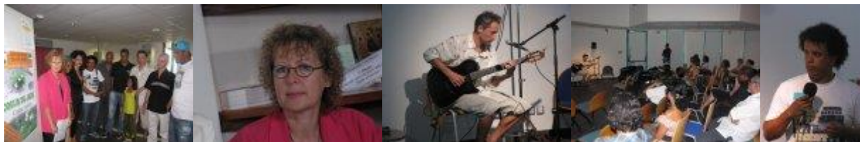
Une partie de l'Equipe