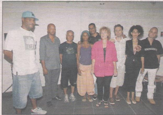
Les acteurs de Force 3 plus ont présenté « Cœur de jade/Ker an jade », un conte qui se veut un « outil pour sortir du conditionnement négatif ».

Ce conte, signé Michèle Petraz, permet à celui qui l'écoute, qui s'en imprègne, de « découvrir combien il est agréable et juste de s'entraider, de chercher à comprendre l'autre, de voir